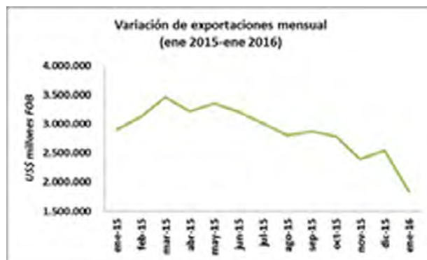
Figura 3. Análisis gráfico de exportación mensual año 2015. Dane, cálculos dinero.

Colombia es un país atractivo para los inversionistas extranjeros, gracias a su posición geográfica, rodeado por dos océanos que le dan salida a diferentes mercados del mundo, y su riqueza en recursos natural. Gracias a estas ventajas, el país evidencia su gran producción y venta de bienes transformados por la industria manufacturera, sino que es rico en alimentos elaborados, hidrocarburos, minerales, granos, frutas, verduras y hortalizas. Los productos de mayor exportación del país, se encuentra el petróleo, carbón, café y el oro. Sin embargo en el periodo comprendido de enero de 2015 a enero de 2016, Colombia tuvo una difícil situación económica, con un 2015 en que las ventas al exterior disminuyeron en más de 30% por diferentes condiciones adversas internas y externas (El Tiempo, 2015).