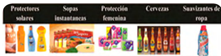
Figura 4. Primeros 5 categorías de productos por recompra en el año 2014. diseño propio, datos extraídos La Republica.

como uno de los de mayor aumento en las compras, la categoría de alimentos es la que tiene más presencia en el mercado de los colombianos, con 43%; ganando sobre las bebidas, que tienen 7%; lácteos, con 17%; cuidado personal, con 24%, y limpieza del hogar, con 10%. El lugar donde más se compran estos productos, está liderado por las grandes cadenas de debido a que en estos almacenes es donde, según García, los compradores reúnen más productos y pagan un solo monto. No obstante, estos bienes pueden conseguirse en otros canales como las tiendas de barrio (Oliveros, 2014).