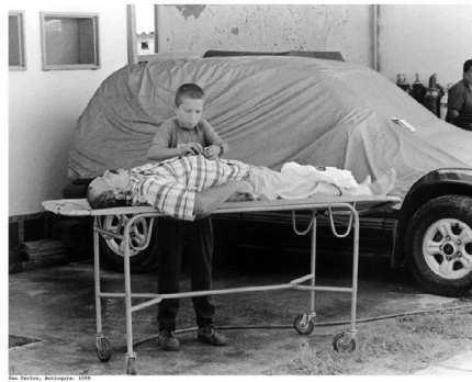
Niño cierra la camisa de su padre asesinado 1998