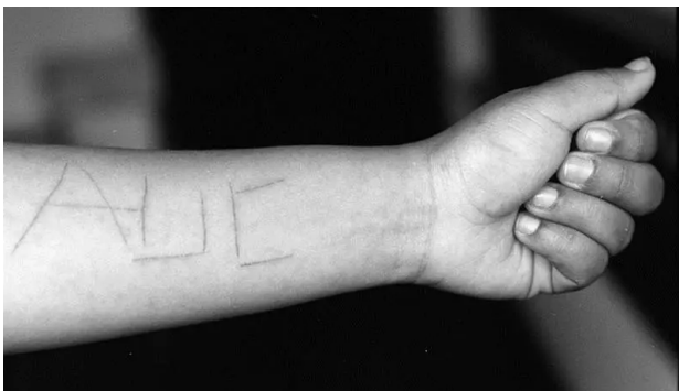
Iniciales (AUC) marcadas a cuchillo por paramilitares en el brazo de una joven de 18 años a la que secuestraron y violaron