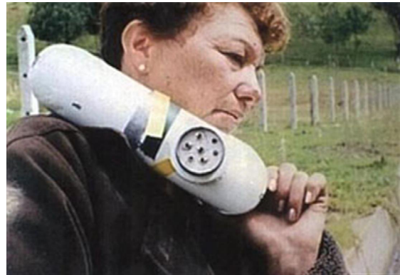
Collar Bomba por las FARC a campesina 2000