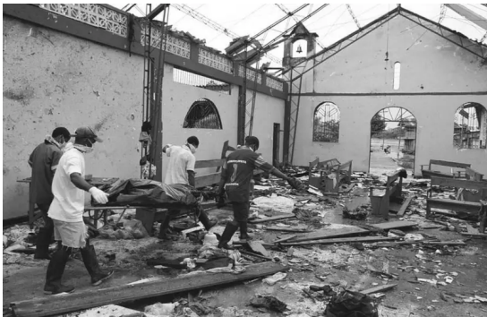
Víctimas de ataque de la guerrilla, Chocó. 2002.