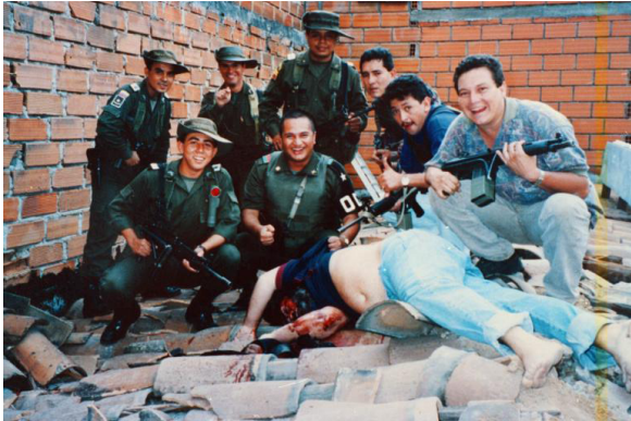
Captura y muerte de Pablo Escobar 1993