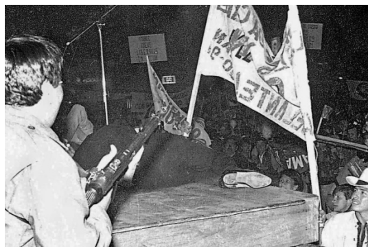
Asesinato de Luis Carlos Galán 1989