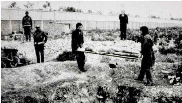
Fosa común de desaparecido 1986