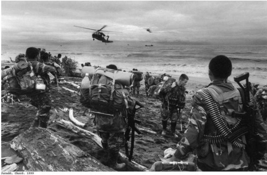
Figura 3. Fotografía masacre de Bojayá por Jesus Abad Colorado