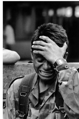
Soldado llora desconsolado porque la guerrilla asesinó a su hermanita de 13 años.