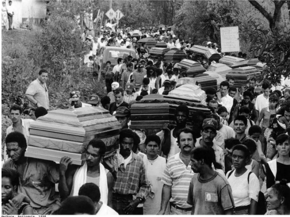
Entierro colectivo de víctimas 1998