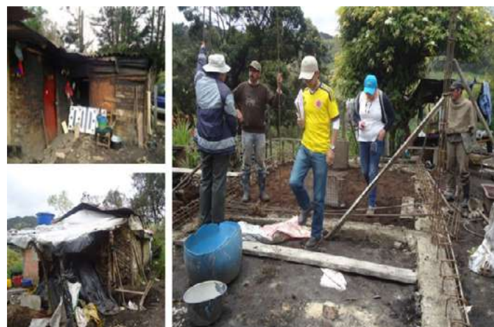
Imagen No 2: Elaboración de una casa a una familia necesitada en Cúcuta.