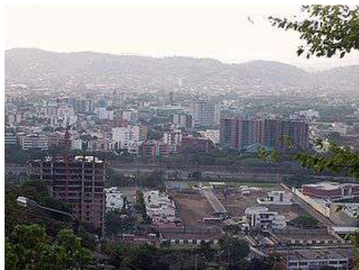
Imagen No1: Panorama de la Ciudad de Cúcuta.