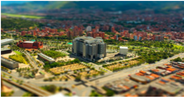
Figura 4 Edificio Inteligente de EPM