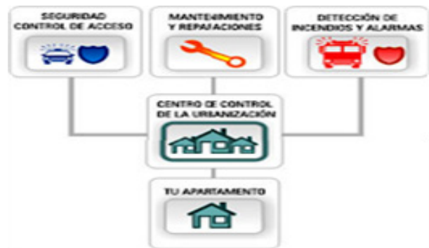
Figura. 7 Infraestructura tecnológica de la