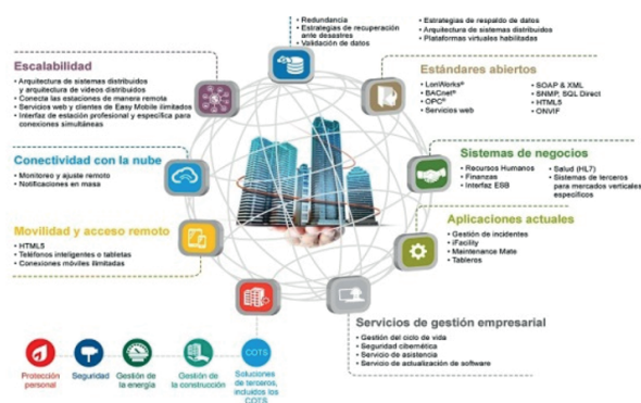
Figura. 8 Sistemas de control distribuidos

Acceso remoto a todos los sistemas de la edificación: En la actualidad, la inteligencia artificial se usa en gran dimensión a la “domótica” que ayuda a que este mejorando continuamente el gasto energético de los edificios inteligentes.