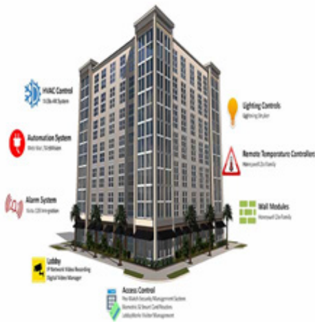
Figura. 5 características de los edificios inteligentes

Ser en gran medida seguros: el principal propósitos de la automatización de edificios es lograr niveles de confianza altos en todos los aspectos, tanto en las emergencias como accidentes. Para todo caso existe un instrumento específico, como en el asunto de los controles de acceso o de la detección contra incendios que son las problemáticas más comunes.