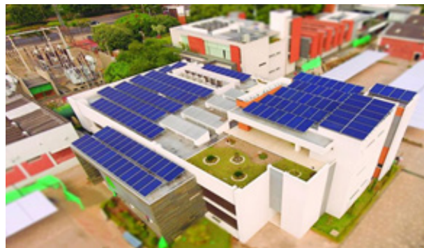
Figura. 2 Campo de la generación de energías limpias

El Establecimiento Industrial Buenavista, está situado en la zona norte del centro de Barranquilla. La edificación consta con puertas de acceso con sensores automáticos, escaleras eléctricas, La luminaria funciona a través de sensores.