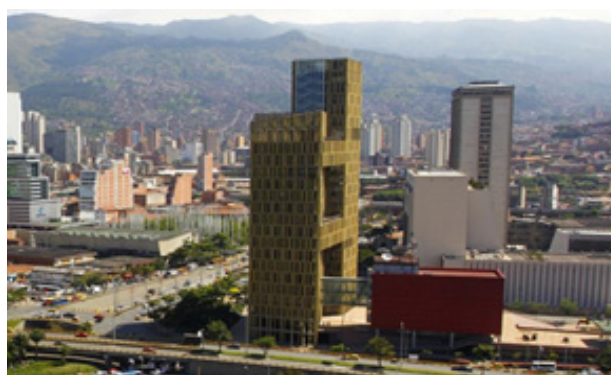
Figura. 3 Edificio de Teleantioquia

Estas torres en Cúcuta fue construido por Centrales Eléctricas de Norte de Santander, representa la vía al campillo de la generación de energías limpias. Está situado en el sector de Sevilla.