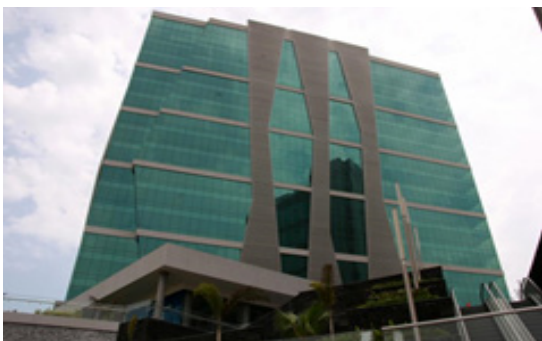
Figura. 1 Centro Empresarial Buenavista

Aquí se pueden observar algunas edificaciones que han empezado a implementar las nuevas tecnologías en Colombia.