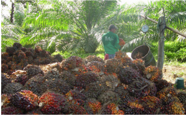
Figura 2 Cultivo Palma