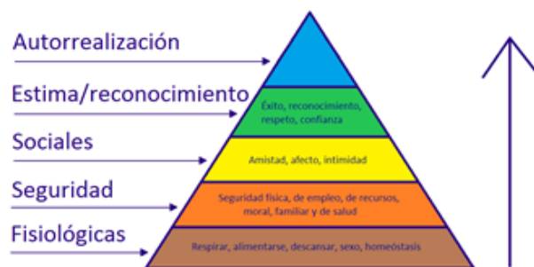
Figura 2 Pirámide de Maslow. (Acosta, 2012)

Autorrealización: el impulso de ser lo que se es capaz de ser; incluye el crecimiento, alcanzar el potencial de uno y la autosatisfacción. (Acosta, 2012).