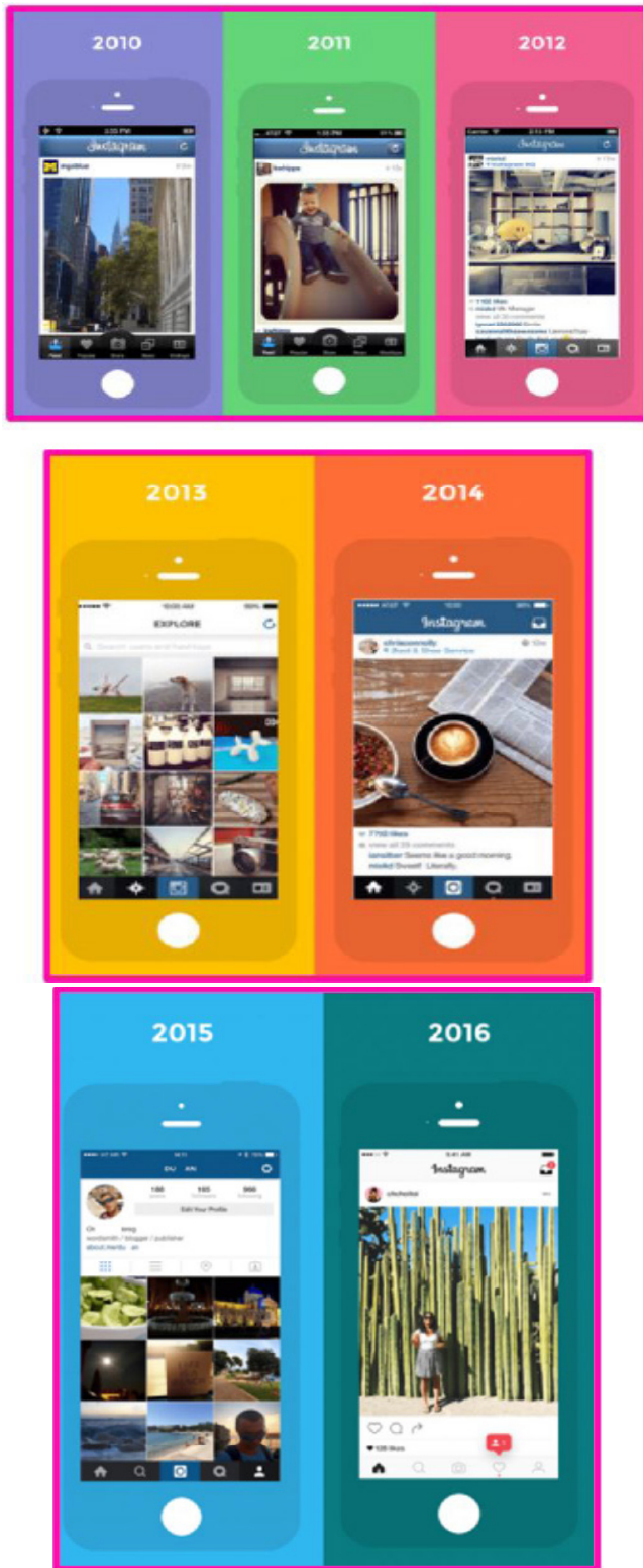
Figura 1: Evolución de la interfaz gráfica de Instagram desde sus inicios.