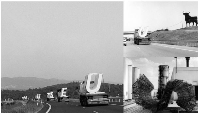
Imagen 1. Traslado de cinco letras de grandes dimensiones desde Madrid hasta el Museo de Bellas Artes de Castellón por los arquitectos mansilla y Tuñón en julio de 1999.

Para comprender un poco mas sobre la Arquigrafía se realizó un análisis de los diferentes medios en la que esta es aplicada, también se adjuntaron imágenes las cuales explican de forma clara y concisa como se puede utilizar en los diferentes medios.