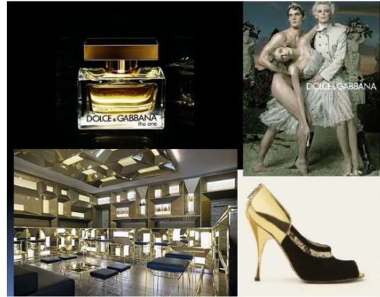
Imagen 3. Aplicación de la Arquigrafía en una marca.

Aquí se puede apreciar una Arquigrafía hecha de forma sencilla, simple y limpia la cual contiene colores que son agradables a simple vista, este ejemplo es uno de muchos que se pueden utilizar al momento de hacer un diseño en el interior de un edificio, oficina, etc.