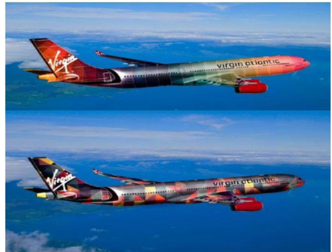
Imagen 4. Aplicación de marca y arquigrafía.

En esta tienda de Dolce & Gabbana la arquigrafía que utilizaron fue de forma simple, sencilla y elegante lo cual llama la atención del consumidor al momento de entrar en sus instalaciones, cabe aclarar que también el manejo de las luces es muy importante ya que la iluminación es algo que también capta la atención de los clientes.