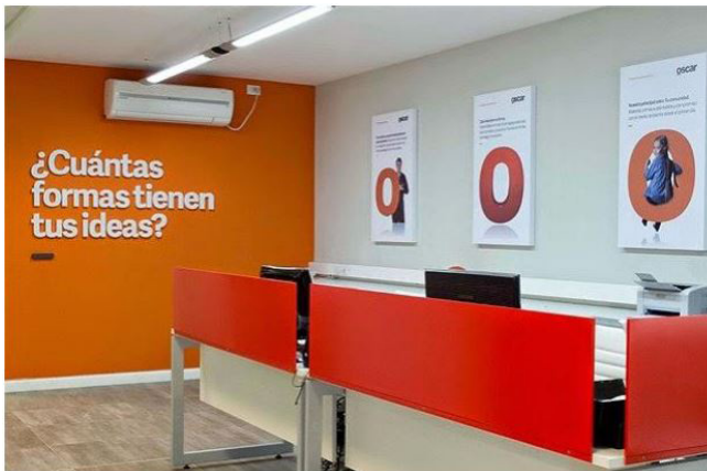
Imagen 2. Arquigrafía en un espacio interior.

En esta imagen se puede apreciar el traslado que se hizo de unas letras hasta un museo las cuales en el camino formaban la palabra “MUSEU” este es un ejemplo aruigráfico muy ingenioso y creativo. Ya que nos puede dar a entender que de formas simples y sencillas también se puede hacer algo creativo y llamativo para la gente.