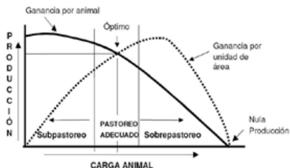
Figura 1. Relación entre carga animal y la respuesta productiva de los animales individual y por unidad de superficie.

La carga animal adecuada será aquella que maximice los retornos económicos por unidad de superficie, manteniendo una adecuada productividad por animal, comportamiento que debiese ser permanente en el tiempo. Lo anterior queda reflejado en la Figura 1, en la cual se presenta la clásica respuesta de la productividad, tanto a nivel individual como por unidad de superficie, ante los cambios en la carga animal (Pearson e Ison, 1994).