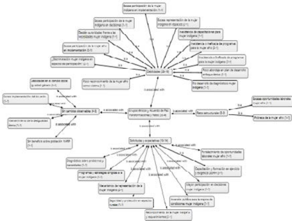
Figura 3. Red semántica o de significados: Grupos étnicos y Acuerdo de paz. Transformaciones y retos

Si, si lo hemos sentido, porque la víctima o sea para mí, es como que nos rechazan todos, no hay nada de acuerdo con uno, como que lo rechazan a uno... tristemente. (P002-MG-54)