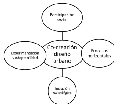
Imagen 02. Co-creación en el diseño urbano

Es así que la co-creación en el diseño urbano ha evolucionado desde un enfoque consultivo hasta un proceso más colaborativo y participativo, donde la comunidad juega un papel activo en la configuración de sus entornos urbanos. La inclusión de la tecnología, la escala urbana, la diversidad y la adaptabilidad son aspectos fundamentales en esta evolución, y se espera que la co-creación continúe siendo una práctica esencial para el diseño de ciudades más inclusivas y habitables en el futuro [12].