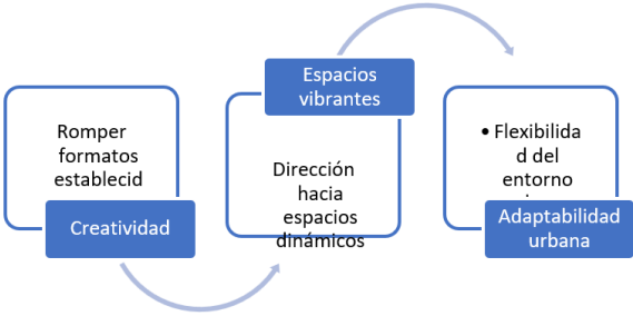
Imagen 01. Innovación en el diseño urbano

Asimismo, los espacios son considerados para un uso y es así que [6] centra en la importancia de diseñar ciudades centradas en las personas. Argumenta que al priorizar las necesidades de los peatones y crear entornos urbanos accesibles y amigables, se fomenta la innovación social y se mejora la calidad de vida en las ciudades. Al igual que [7] donde señala la importancia de la innovación en el diseño.