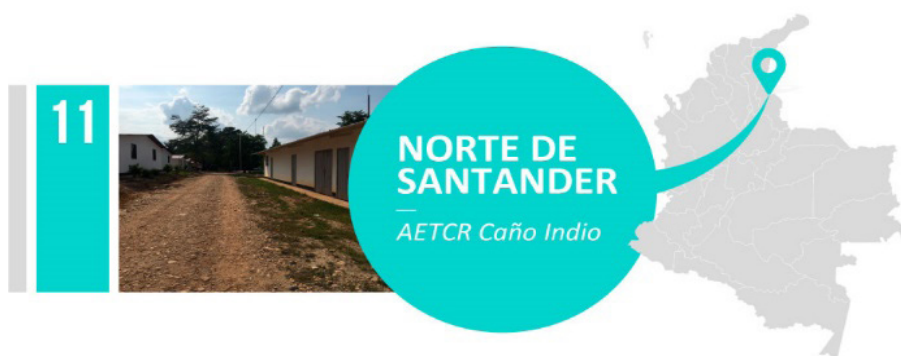
Figura 1. Ubicación AETCR Caño Indio, Tibú - Norte de Santander, Colombia

Su extensión territorial es de 2.696 km, su altitud es de 75 m s. n. m. y su temperatura media es de 32 °C. En este contexto, El ETCR, El Negro Eliecer Gaitán, tiene una altura de 66 msnm con una temperatura promedio entre 23 y 32°C y humedad el 65% por lo tanto se encuentra dentro de un ecosistema de bosque muy húmedo en invierno y húmedo en verano (Figura 1) [10].