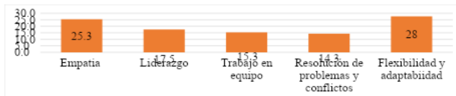
Gráfica 1. Resultados Habilidades Blandas

Los resultados obtenidos mediante la aplicación de la prueba HABA a los 25 colaboradores evidencian un desarrollo favorable de las habilidades blandas dentro de la organización. En términos relativos, la flexibilidad y adaptabilidad se posicionan como la dimensión predominante, seguida por la empatía, el liderazgo, el trabajo en equipo y la resolución de problemas y conflictos. Estos resultados sugieren que los colaboradores poseen competencias interpersonales relevantes para desenvolverse en entornos laborales dinámicos, lo cual constituye un elemento positivo para el desempeño organizacional.