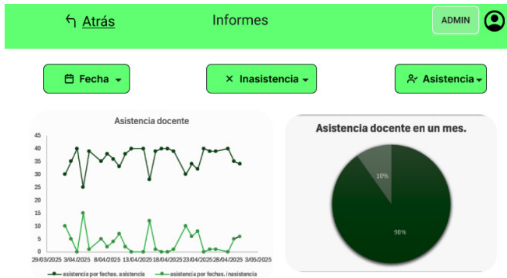
Figura 2. Panel de informe de asistencia docente mensual

En los resultados obtenidos a través del sistema AsisDoc RFID se registró la participación de 35 docentes, con un total de 25 asistencias y únicamente 2 retrasos, distribuidos en 40 salones asignados. Este sistema permitió una identificación rápida y precisa mediante tarjetas RFID, facilitando el control automatizado del ingreso del personal docente. La información se visualiza en un panel de control claro y accesible para los administradores de las instituciones educativas, lo que mejora la toma de decisiones. Del mismo modo, la opción de facilitar exportar los datos contribuye a una mejor trazabilidad y gestión documental. Estos resultados coinciden en gran parte con lo expuesto por Farag [30], quien resalta que los sistemas inteligentes basados en tecnología de identificación por radiofrecuencia mejoran la eficiencia, facilitando la automatización de procesos y la comodidad, reduciendo significativamente errores humanos.