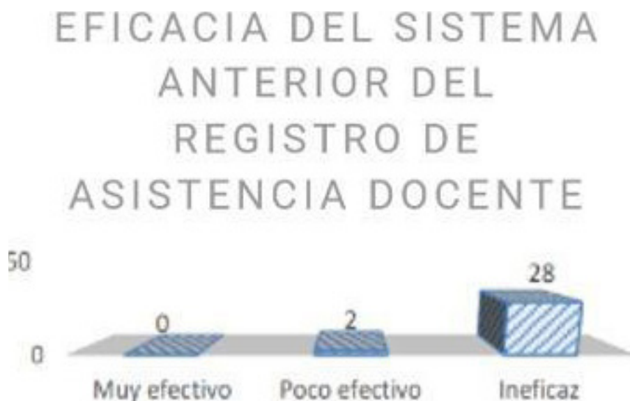
Figura 3. Eficacia del sistema anterior del registro de asistencia docente

como también juega un rol dentro del desarrollo académico de los estudiantes.