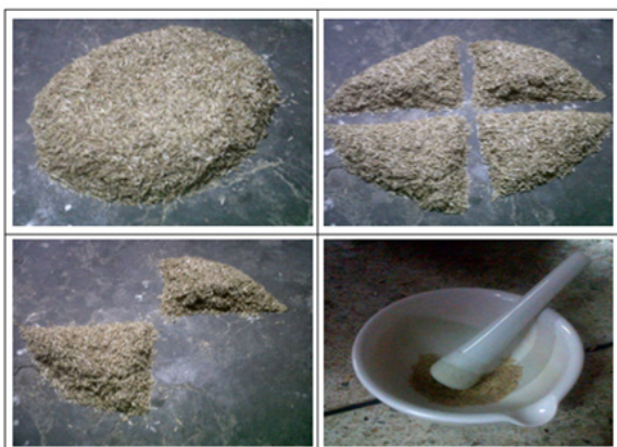
Figura 2. Preparación de la muestra para el análisis de laboratorio.

La prueba de laboratorio para medir el poder calorífico se hace a una pequeña muestra de cascarilla pulverizada, cuyo proceso de preparación pasa por las etapas de cuarteo, molienda y tamizado. El cuarteo consiste en disminuir la cantidad de la muestra recolectada justo después del descascarillado hecho en la arrocera. Se toman 1,5 kg de cascarilla limpia y se colocan sobre una mesa libre de suciedad y con superficie regular en forma de pila triangular, se ejerce presión en la punta para aplanar. Dicho cúmulo de cascarilla se divide en cuatro partes iguales, de las cuales se extraen dos diagonalmente opuestas. Este proceso se repite hasta tener una cantidad cercana a los 100 gramos. Este proceso se muestra en la figura 2.