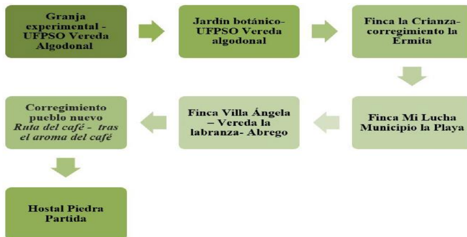
Figura 1. Muestra. (Predios que cumplieron con las características)

Muestra. Siete (7) predios preseleccionados que cumplieron con las características de colaboración e interés por parte del propietario en participar en el proceso, vías de acceso, servicios públicos y ubicación.