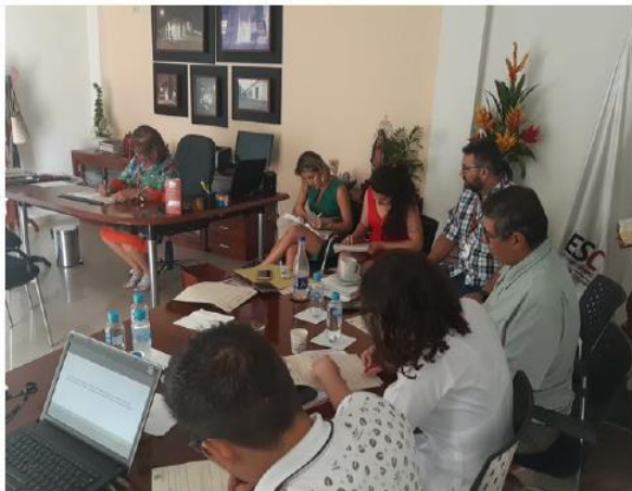
Figura 1, Focus Group a expertos académicos

de estudios superiores COMFANORTE-FESC y estudiante del programa de Administración Financiera de la UDES. Se contextualizó, la situación que presenta el flujo turístico en el municipio de Ocaña y el comportamiento productivo de los predios agropecuarios adyacentes a los lugares turísticos tradicionales, mediante la técnica Focus Group a expertos académicos, productores y mesa turística departamental, se logró identificar algunas características particulares, las cuales hacen necesario crear nuevas alternativas para el esparcimiento del turista y producción de ingresos extras para los pequeños productores.