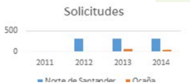
Gráfico 1. Consolidado solicitudes