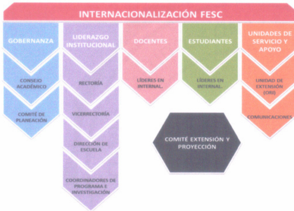
Imagen 1. Actores de la Internacionalización en la FESC

ARTÍCULO 8: Actores de la Internacionalización: La FESC agrupa los autores de la internacionalización por gobernanza institucional, liderazgo institucional, docentes, estudiantes, unidades de servicio y apoyo y comité de Extensión y Proyección, soportada en la importancia de la transversalidad partiendo de la misión, la cual se estructura en las funciones misionales de la educación superior información consolidada en la siguiente Imagen.