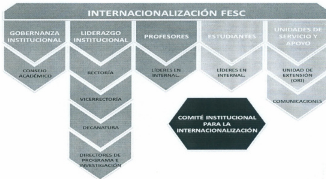
Gráfica 1. Autores de la internacionalización.

unidades de servicio y apoyo y comité para la internacionalización, soportada en la importancia de la transversalidad partiendo de la misión, la cual se estructura en las funciones misionales de la educación superior información consolidada en la gráfica 1.